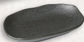
M-4540 ¥680 黒筋小判皿 小 17×9.6×2.5