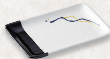
M-4517 ¥1,850 カラスアゲハ 焼物皿 20×14×2