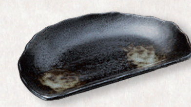
M-4531 ¥900 半月皿 黒白吹き 21×13.3×2.5