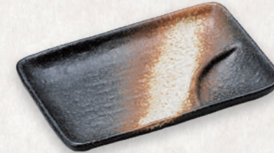
M-4524 ¥750 備前風 6.0仕切角皿 17.5×12×2