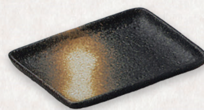
M-4522 ¥750 備前風 6.0角皿 17.5×12×2