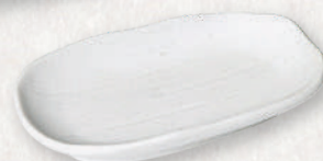
M-4539 ¥680 白筋小判皿 小 17×9.6×2.5