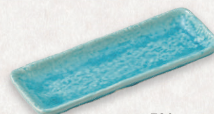
M-4526 ¥780 フリットトルコ突出皿 21.5×8.2×2.3