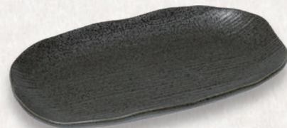
M-4538 ¥980 黒筋小判皿 大 22.7×13×2.8