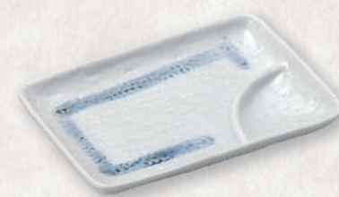
M-4523 ¥750 おふけ 6.0仕切角皿 17.5×12×2