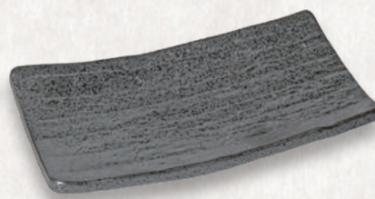
M-4511 ¥1,350 南蛮天目足付焼物皿 22×12×3.2