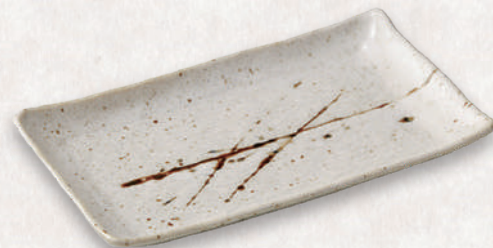
M-4510 ¥1,100 アメ乱れ焼物皿 23.6×14×2.3