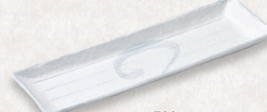
M-4502 ¥700 アジアン粉引突出皿 小 26×8.7×1.8