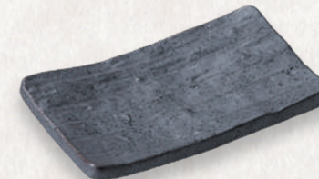
M-4527 ¥720 南蛮天目足付角のり皿 15×9×3