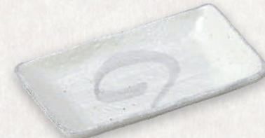
M-4528 ¥600 アジアン粉引角のり皿 16.5×10.5×2