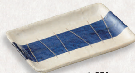
M-4518 ¥1,850 刻一刻 焼物皿 20×14×2