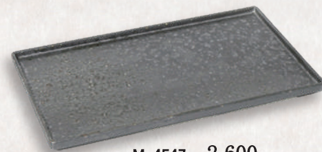
M-4547 ¥2,600 月夜空長角皿 23.5×14×1.4