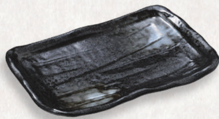
M-4516 ¥900 そぎ7.0角皿 黒白吹き 21.2×13.3×3