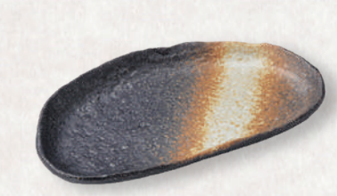
M-4532 ¥750 備前風半月皿 18.2×10.4×2