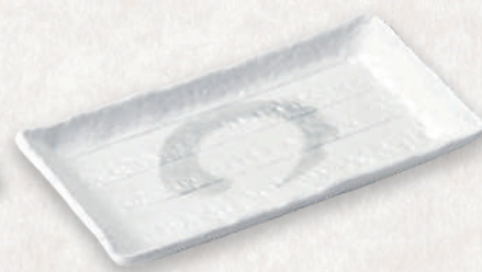
M-4512 ¥800 アジアン粉引焼物皿 21×11.7×1.8