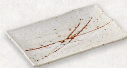
M-4521 ¥900 アメ乱れ浜付長角皿 18.6×12×2.2