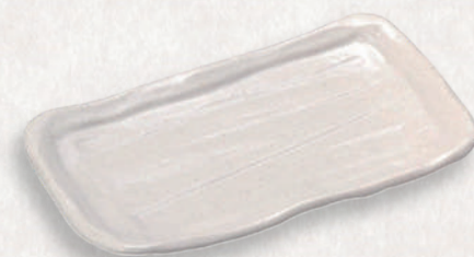
M-4515 ¥900 そぎ7.0角皿 白 21.2×13.3×3