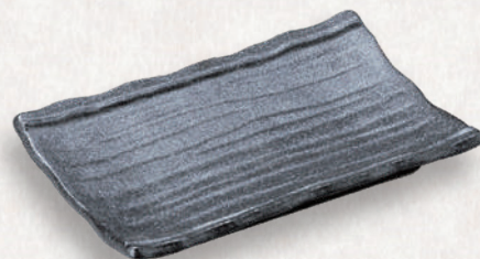
M-4514 ¥950 木目焼物皿 黒 20.8×13×3