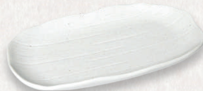
M-4537 ¥980 白筋小判皿 大 22.7×13×2.8