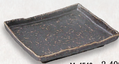
M-4546 ¥2,400 金鱗高台長角皿 17×14.2×3