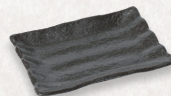
M-4541 ¥820 そぎ 5.5角皿 15.7×11×2.5